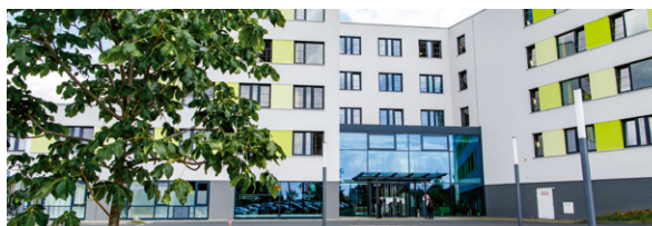
ELBLAND Reha- und Präventions-GmbH